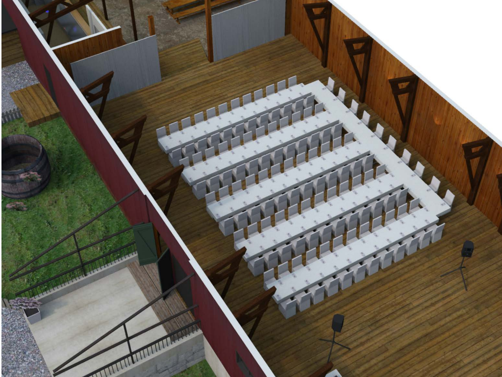
HONNÖRSBORD MED PLATS FÖR 10 PERSONER 5 TUNGOR MED 24 PERSONER PÅ VARJE TUNGA