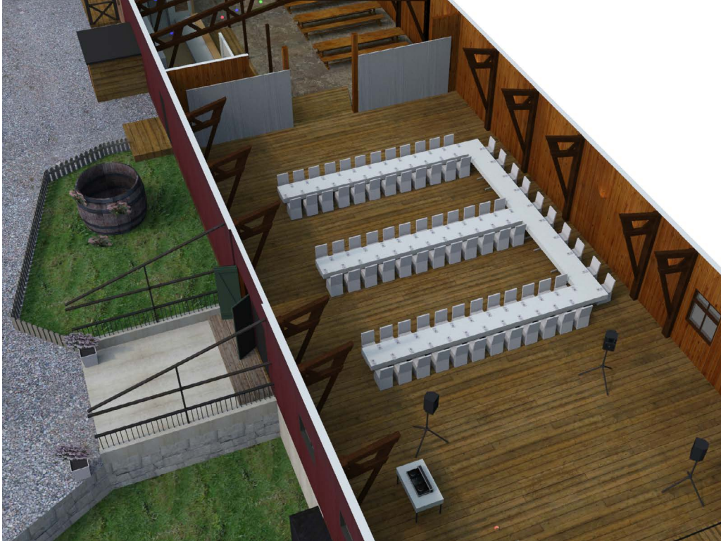
HONNÖRSBORD MED PLATS FÖR 10 PERSONER 3 TUNGOR MED 24 PERSONER PÅ VARJE TUNGA